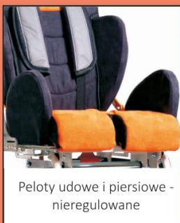
Peloty udowe i piersiowe - nieregulowane