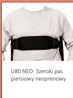
U80 NEO- Szeroki pas piersiowy neoprenowy