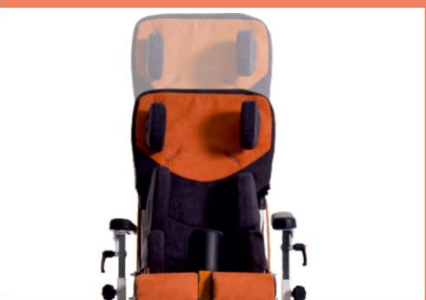
Regulacja wysokości oparcia.