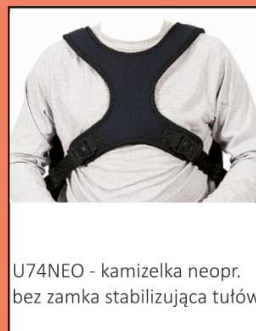
U74NEO - kamizelka neopr. bez zamka stabilizująca tułów