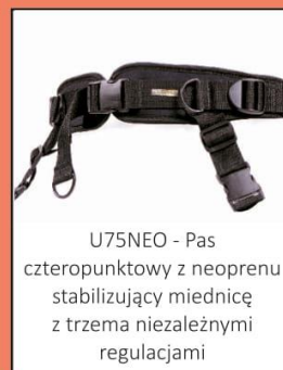
U75NEO - Pas czteropunktowy z neoprenu stabilizujący miednicę z trzema niezależnymi regulacjami