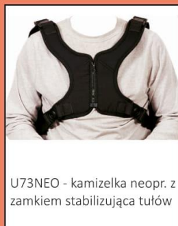
U73NEO - kamizelka neopr. z zamkiem stabilizująca tułów