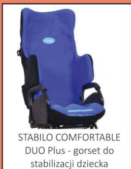
STABILO COMFORTABLE DUO Plus - gorset do stabilizacji dziecka