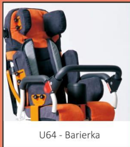
U64 - Bariierka