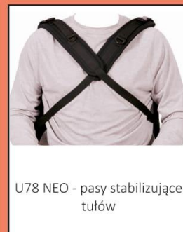
U78 NEO - pasy stabilizujące tułów