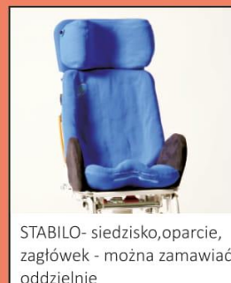
STABILO- siedzisko, oparcie, zagłówek - można zamawiać oddzielnie