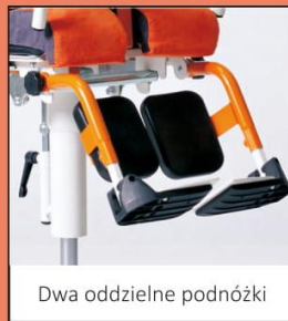
Dwa oddzielne podnóżki