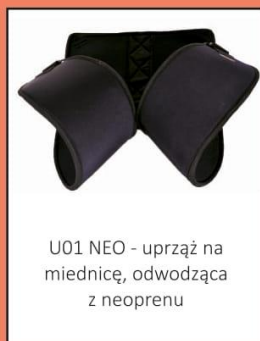
U01 NEO - uprząż na miednicę, odwodząca z neoprenu