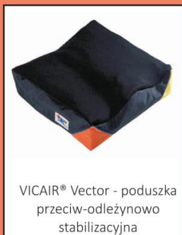
VICAIR® Vector - poduszka przeciw-odleżynowo stabilizacyjna