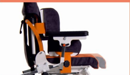
Regulacja głębokości siedziska.