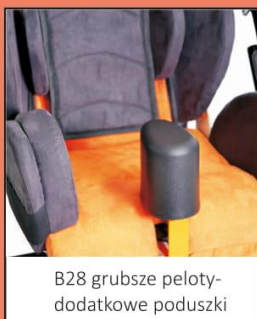
B28 grubsze peloty- dodatkowe poduszki