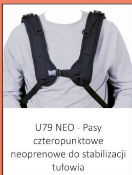
U79 NEO - Pasy czteropunktowe neoprenowe do stabilizacji tułowia