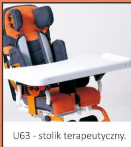
U63 - stolik terapeutyczny.