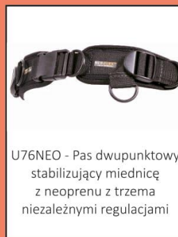
U76NEO - Pas dwupunktowy stabilizujący miednicę z neoprenu z trzema niezależnymi regulacjami